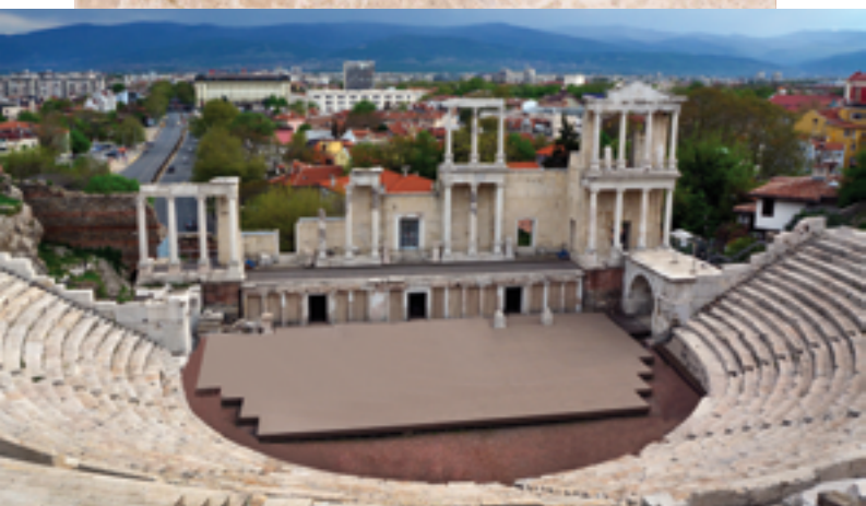
Античният театър, I в.

Т ова е най-големият и най-красивият от всички градове. Отдалеч блести красотата му и една много голяма река тече съвсем близо до него.