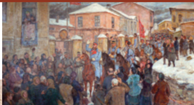
„Посрещане на генерал Гурко в Пловдив“, худ. Нягул Станчев

Започва Руско-турската освободителна война от 1877–1878 г. На 4 януари 1878 г. руските войски под командването на ген. Гурко освобождават Пловдив. В следващите дни войските на Сюлейман паша са окончателно разгромени.