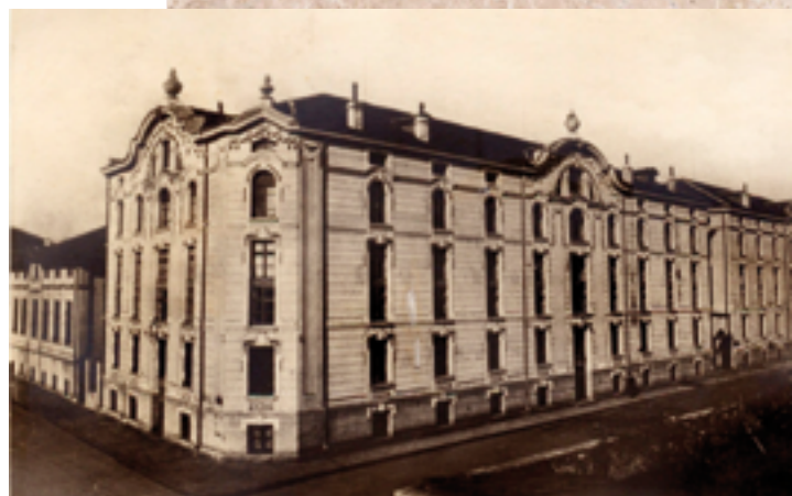
Складовете на Кудоглу, Пловдив, Тютюневият град, 1927 г.

За благоустрояването на Пловдив през 30-те години на XX век особени заслуги има кметът Божидар Здравков. Той успява да реализира мащабна благоустройствена програма, наложила новия облик на Пловдив.