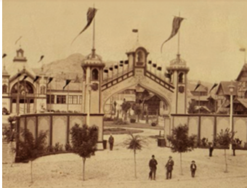
Първото българско изложение продължава 75 дни и е посетено от близо 168 000 души.

Продължител на изложението е Първият международен мострен панаир (1937 г.), открит в Пловдив с участието на 1070 български изложители и 385 фирми от 8 западноевропейски държави и САЩ.