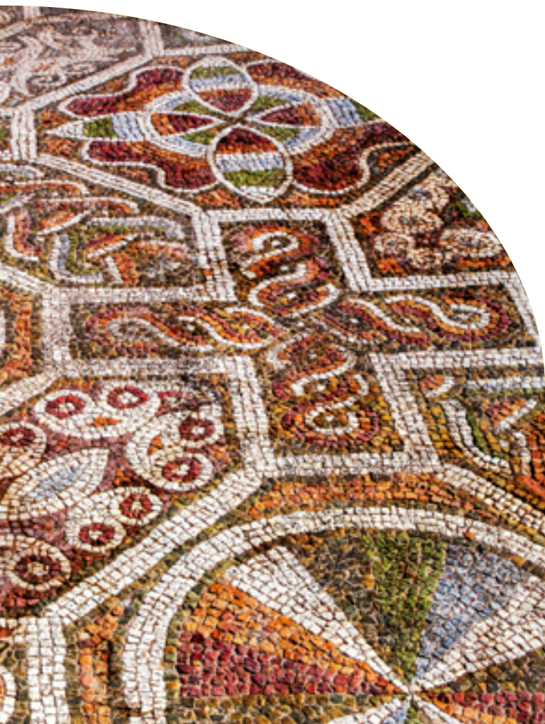
Епископската базилика на Филипол (IV-VI в.)