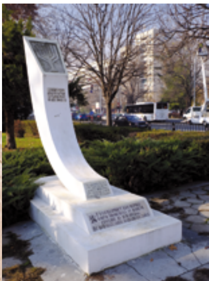
Паметник, посветен на спасяването на пловдивските евреи в Дондуковата градина в Пловдив.

Пловдив е известен като град на толерантността. Тук от векове съжителстват различни религиозни общности. В града днес живеят – освен българи – арменци, евреи, турци, роми, малко чехи, руснаци, италианци, гърци и др.