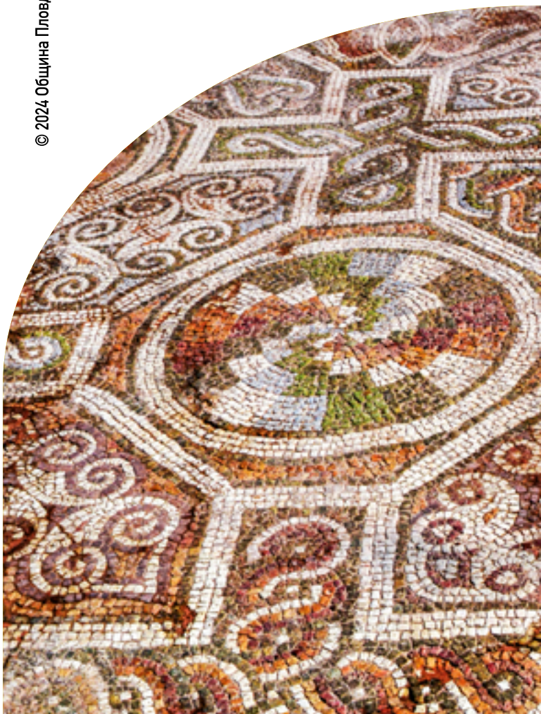
Епископската базилика на Филипол (IV-VI в.)