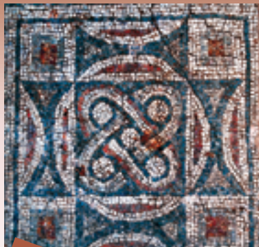
3 La basílica episcopal es el templo cristiano primitivo más grande de las tierras búlgaras.