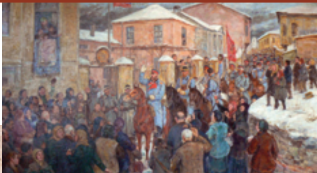
“Dando la bienvenida al general Gurko en Plovdiv”, artista Nyagul Stanchev

Comenzó la Guerra de Liberación Ruso-Turca de 1877 a 1878. El 4 de enero de 1878, las tropas rusas bajo el mando del General Gurko liberaron la ciudad de Plovdiv. En los días siguientes, las tropas de Suleyman Pasha finalmente fueron derrotadas.