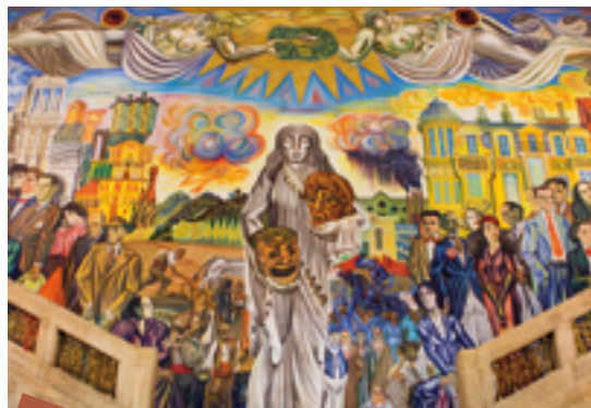
10 Plovdiv es la primera ciudad búlgara con una compañía de teatro y un teatro desde 1881 - cartel de Ioan Leviev en el teatro.