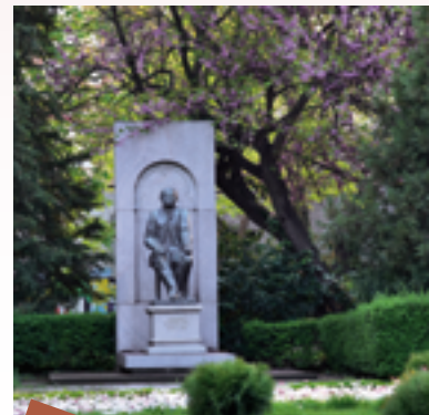
8 El Jardín de Dondukov (1878) es el parque más antiguo de las tierras búlgaras.