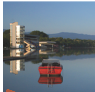
11 Aquí se encuentra la base de remo más grande de los Balcanes, un lugar favorito para la recreación y el deporte.