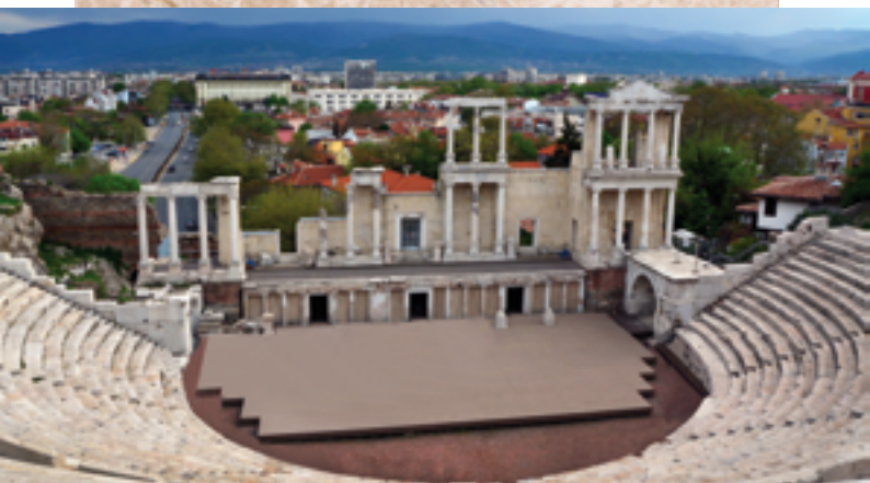
Teatro antiguo, siglo I

Es la más grande y hermosa de todas las ciudades. Su belleza brilla desde lejos, y muy cerca de ella corre un río muy caudaloso.