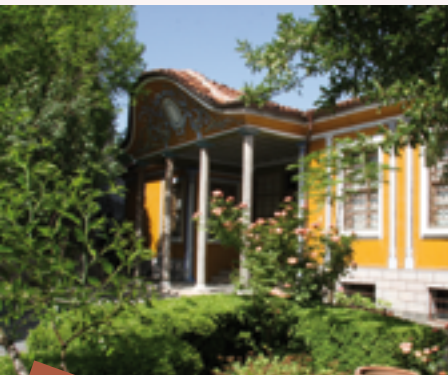
5 La primera editorial de libros en Bulgaria se estableció en Plovdiv, fundada por Hristo G. Danov en 1855.