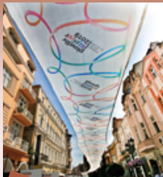
2 Plovdiv es la primera ciudad búlgara designada Capital Europea de la Cultura 2019.