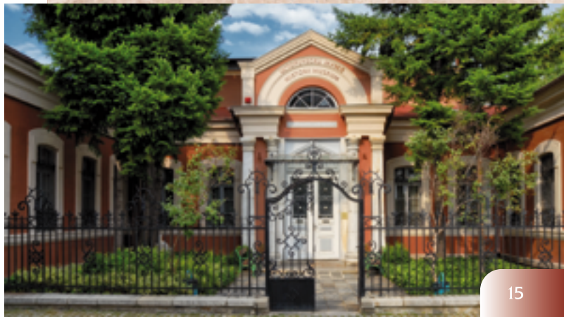
El edificio de la Asamblea Regional de la Rumelia Oriental - hoy en día Museo de Historia Regional - Plovdiv

El ingeniero y arquitecto checo Josef Schnitter, el arquitecto suizo Pierre-Paul Montany, el gran paisajista y constructor de parques, el suizo Lucien Chevallaz, el creador de la estenografía búlgara, el esloveno Anton Bezensek se establecieron en la ciudad. Con su notable creatividad, dejaron una profunda huella en el ascenso de Plovdiv como ciudad europea moderna.