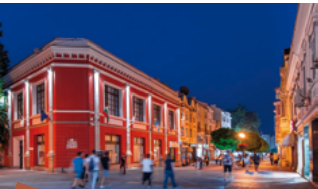
9 La calle principal de Plovdiv es la zona peatonal más larga de Europa: 1750 m.