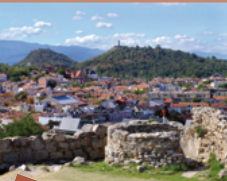
1 Plovdiv es la ciudad viva más antigua de Europa y una de las más antiguas del mundo.