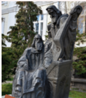
6 La primera celebración de los santos hermanos Cirilo y Metodio – 11 de mayo de 1856.